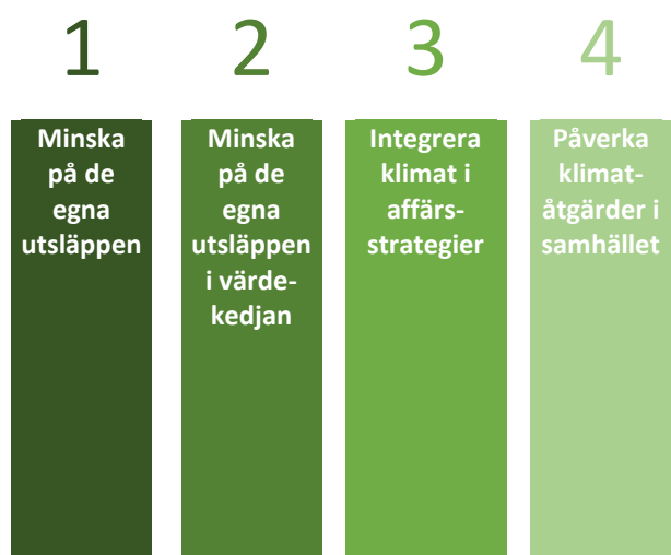
Figur 2. Inspirerad från rapporten the 1.5°C Business Playbook

Karlstads universitet, har varit med och tagit fram en strategi för att företag ska kunna nå målen om att bli klimatneutrala vilket beskrivs i rapporten The 1.5 °C Business Playbook som förklarar fyra steg som företag och organisationer behöver implementera i sina verksamheter för att bidra till minskade utsläpp. Rapportens mål är att förbereda företagen att kunna manövrera rätt i den historiskt snabbaste ekonomiska omställningen vi står inför genom en konkret färdplan. Strategin behöver inte nödvändigtvis ske linjärt i den ordning se står uppställda utan kan ske utifrån den aktivitet som är mest gynnsam för företaget att starta med. Se figur 2.